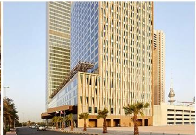
FOUR SEASONS HOTEL KUWAIT AT BURJ ALSHAYA