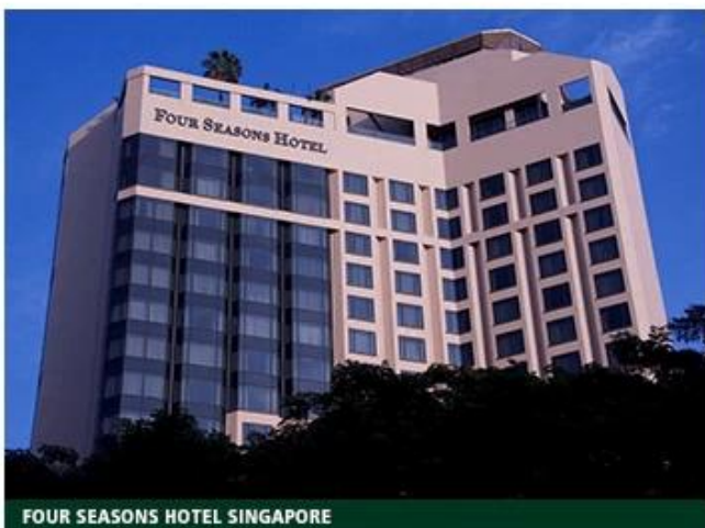
FOUR SEASONS HOTEL SINGAPORE