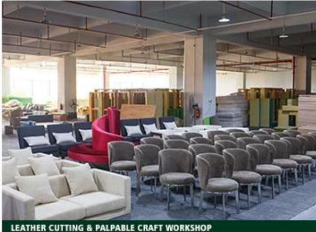
LEATHER CUTTING & PALPABLE CRAFT WORKSHOP