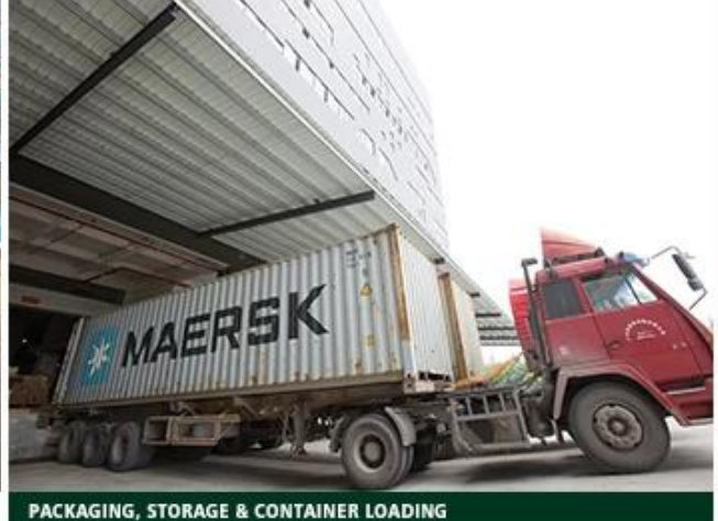
PACKAGING, STORAGE & CONTAINER LOADING