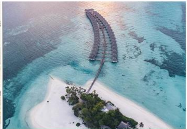
LUX SOUTH ARI ATOLL