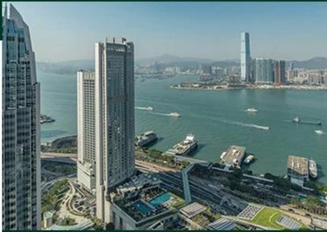
FOUR SEASONS HONG KONG