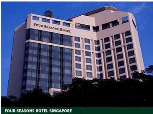
FOUR SEASONS HOTEL SINGAPORE