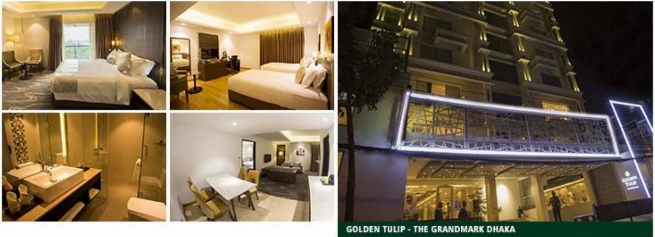
GOLDEN TULIP - THE GRANDMARK DHAKA