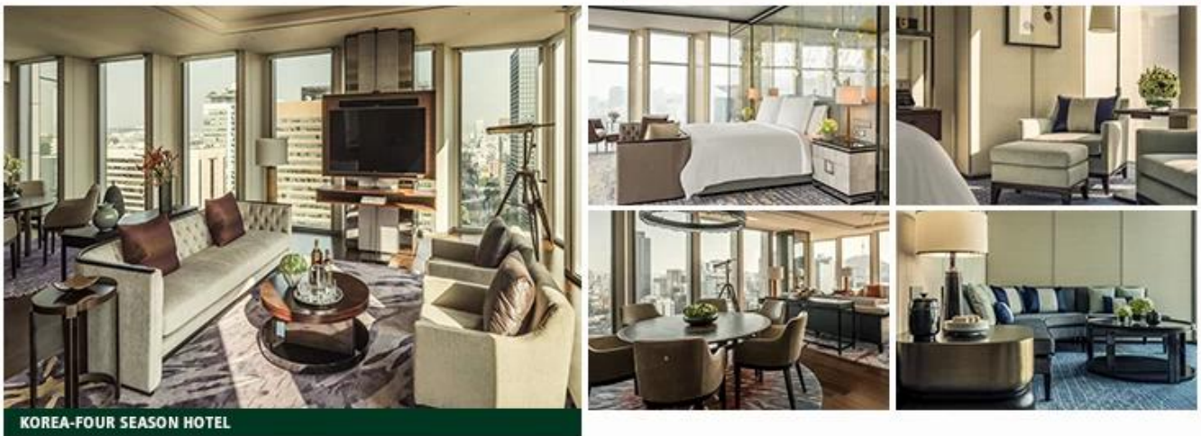
KOREA-FOUR SEASON HOTEL