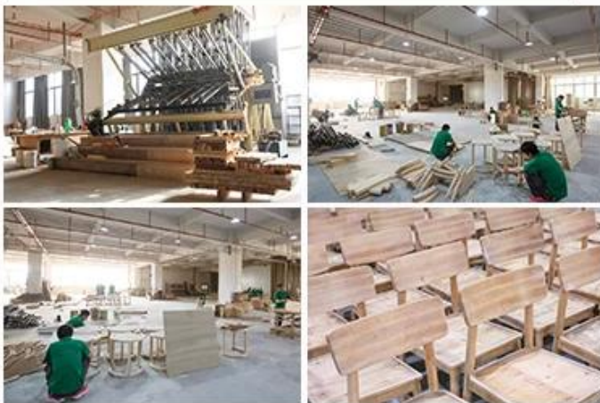
SOLID WOOD WORKSHOP