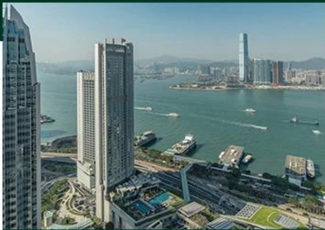
FOUR SEASONS HONG KONG