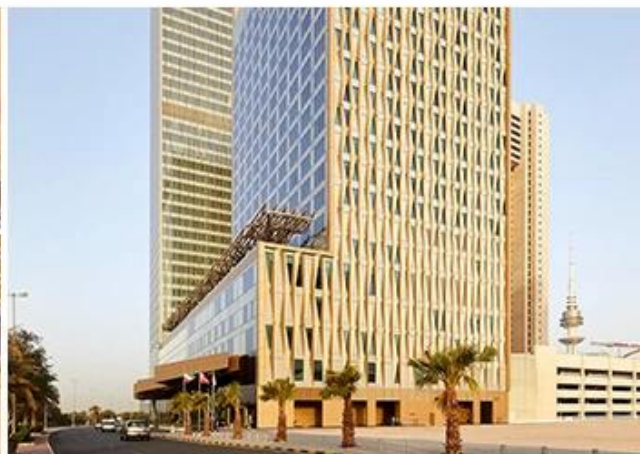
FOUR SEASONS HOTEL KUWAIT AT BURJ ALSHAYA