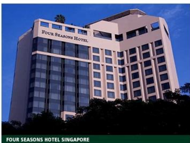
FOUR SEASONS HOTEL SINGAPORE