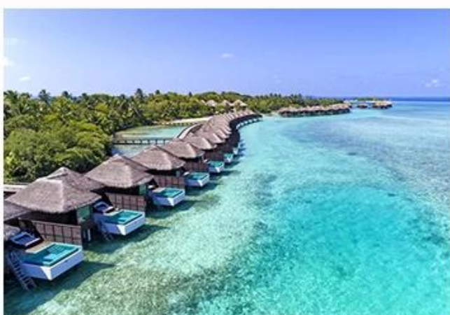
SHERATON MALDIVES FULL MOON RESORT & SPA