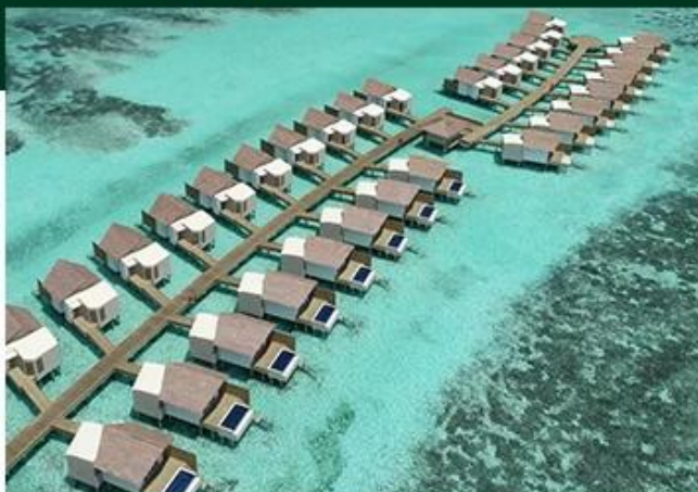
HARDROCK HOTEL MALDIVES