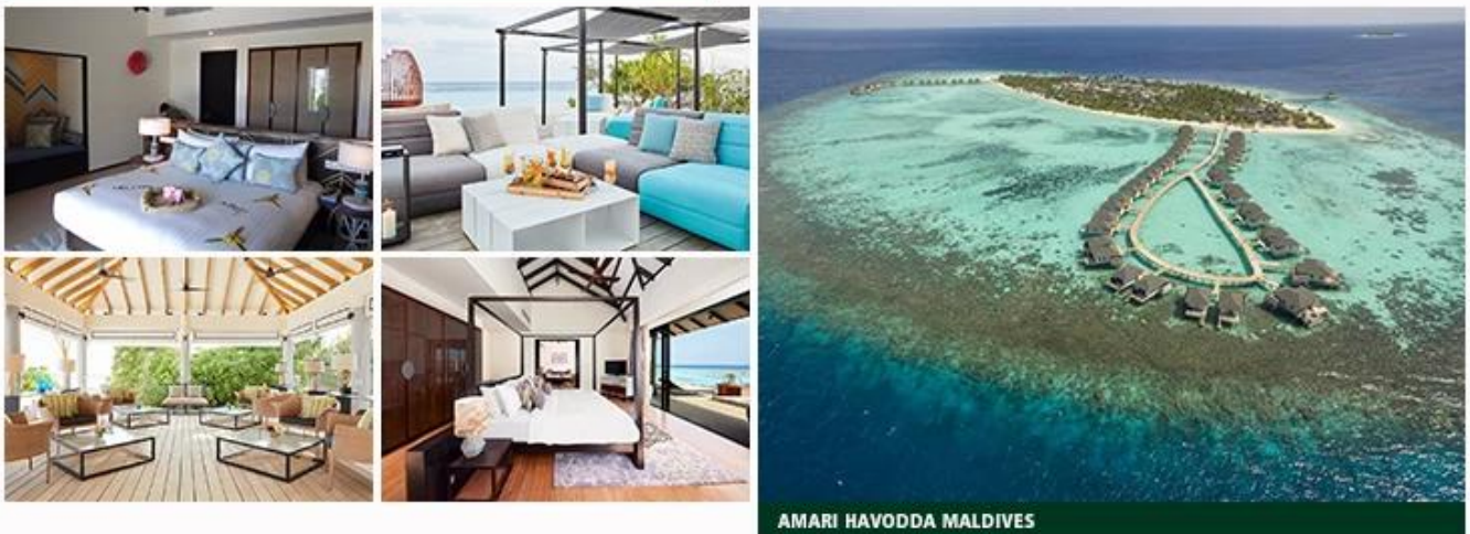
AMARI HAVODDA MALDIVES