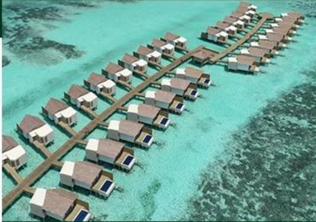
HARDROCK HOTEL MALDIVES