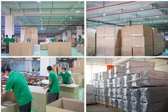
PACKAGING, STORAGE & CONTAINER LOADING