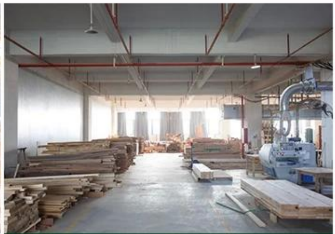
SOLID WOOD WORKSHOP