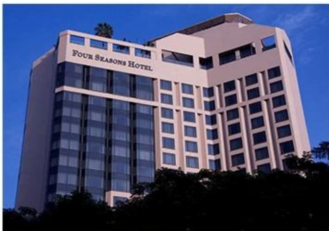
FOUR SEASONS HOTEL SINGAPORE