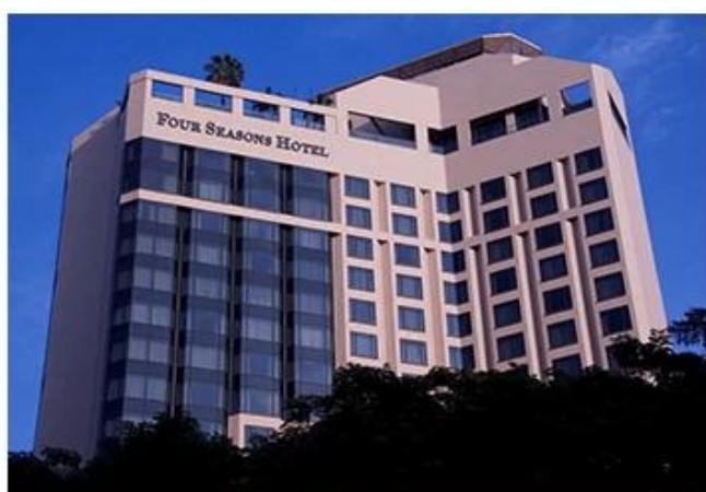
FOUR SEASONS HOTEL SINGAPORE