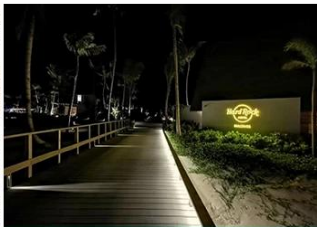
HARDROCK HOTEL RESTAURANT MALDIVES