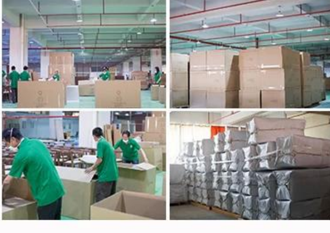
PACKAGING, STORAGE & CONTAINER LOADING