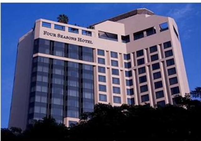
FOUR SEASONS HOTEL SINGAPORE