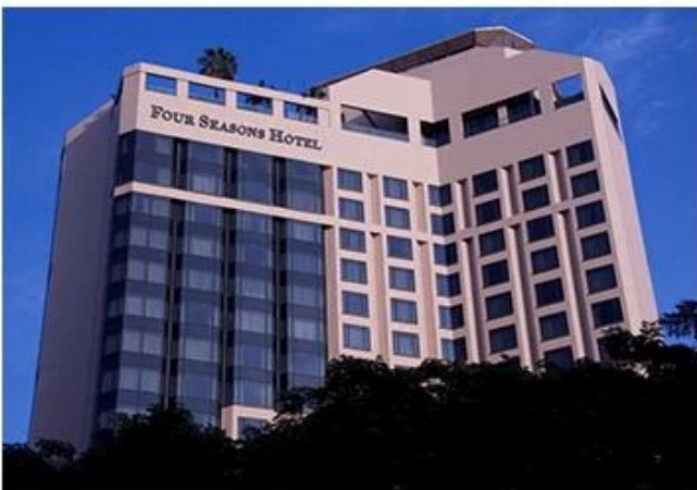
FOUR SEASONS HOTEL SINGAPORE