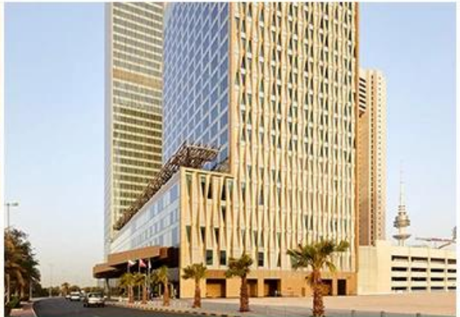
FOUR SEASONS HOTEL KUWAIT AT BURJ ALSHAYA