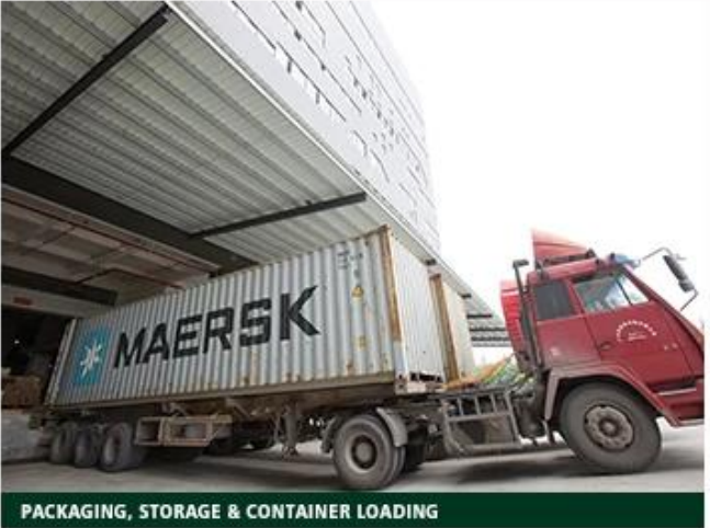
PACKAGING, STORAGE & CONTAINER LOADING