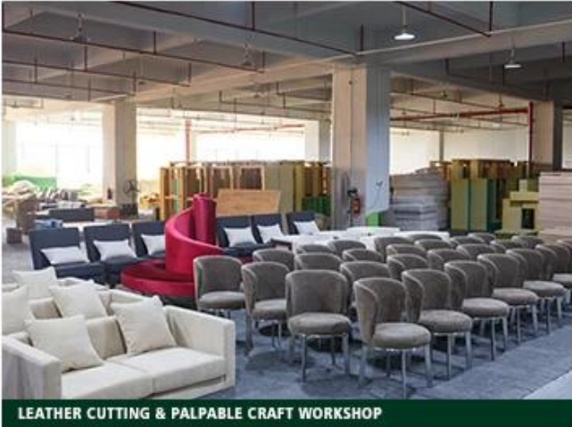
LEATHER CUTTING & PALPABLE CRAFT WORKSHOP