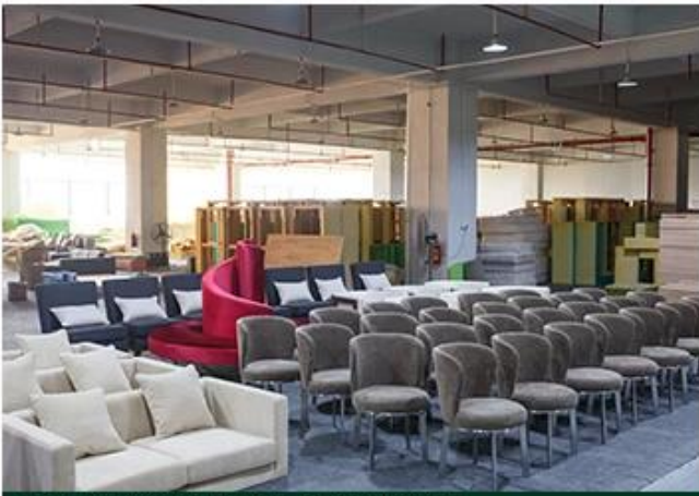
LEATHER CUTTING & PALPABLE CRAFT WORKSHOP