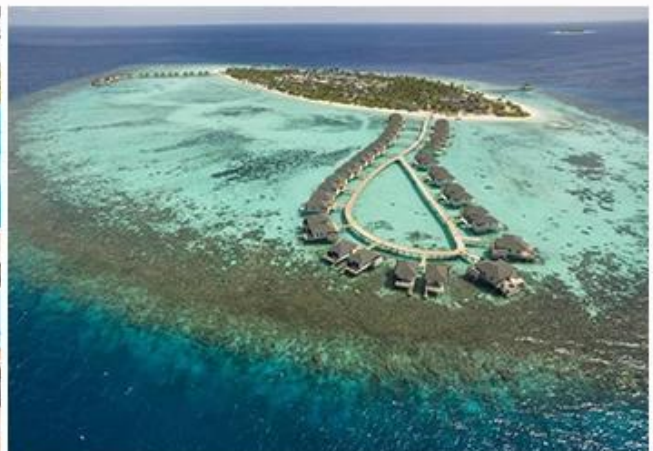
AMARI HAVODDA MALDIVES