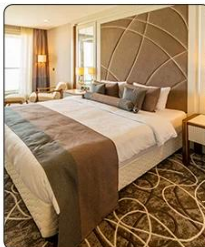
圖 紙 圖 例 說明