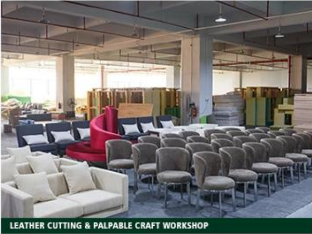
LEATHER CUTTING & PALPABLE CRAFT WORKSHOP