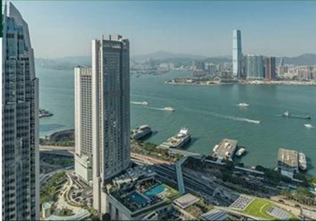
FOUR SEASONS HONG KONG