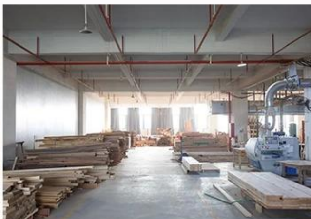
SOLID WOOD WORKSHOP