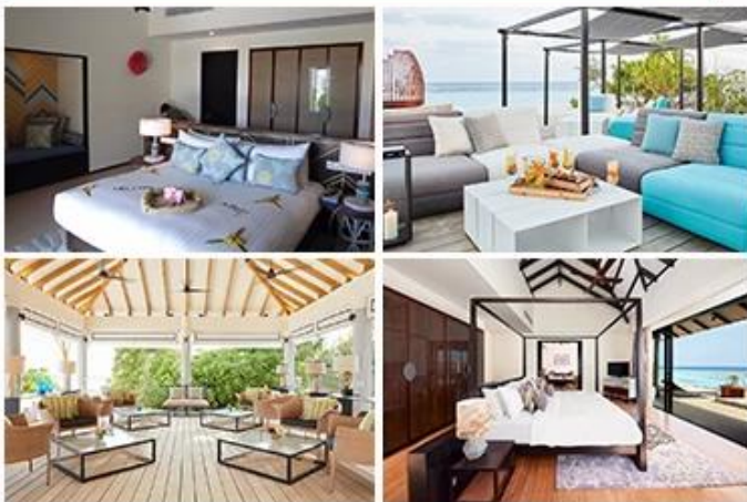
AMARI HAVODDA MALDIVES