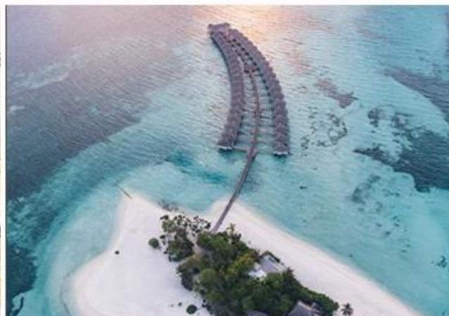
LUX SOUTH ARI ATOLL