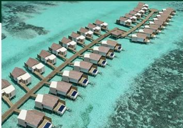
HARDROCK HOTEL MALDIVES