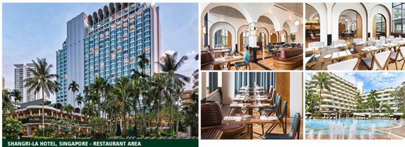
SHANGRI-LA HOTEL, SINGAPORE - RESTAURANT AREA