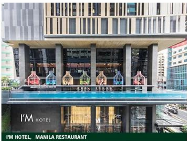
I'M HOTEL, MANILA RESTAURANT