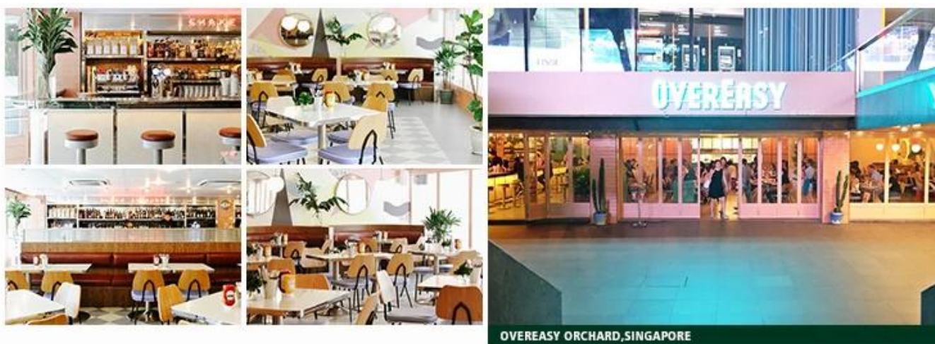
OVEREASY ORCHARD, SINGAPORE

Картина: Используйте полузакрытую краску, открытую краску и глянцевую краску Китая Фатонам бренд Dabao.