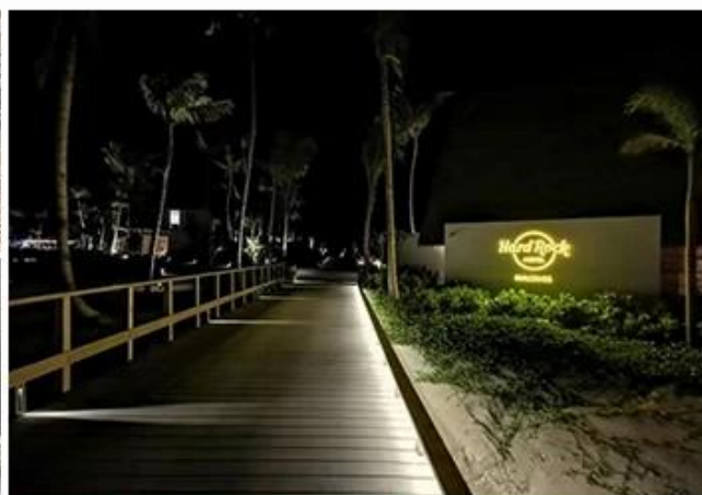
HARDROCK HOTEL RESTAURANT MALDIVES