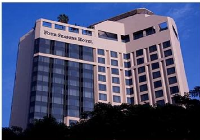
FOUR SEASONS HOTEL SINGAPORE