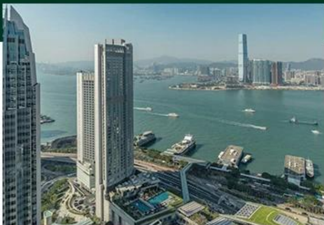
FOUR SEASONS HONG KONG