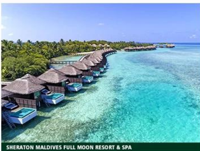
SHERATON MALDIVES FULL MOON RESORT & SPA