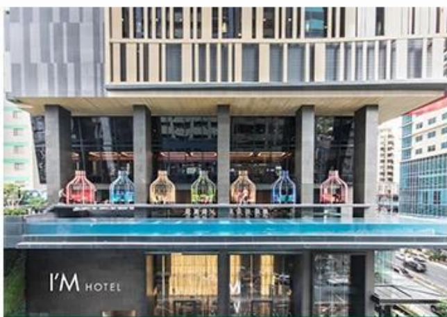
I'M HOTEL, MANILA RESTAURANT