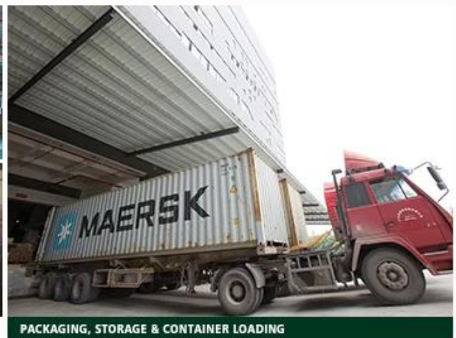
PACKAGING, STORAGE & CONTAINER LOADING