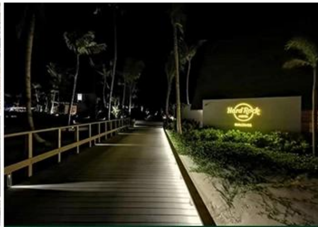
HARDROCK HOTEL RESTAURANT MALDIVES