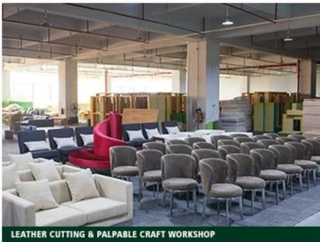
LEATHER CUTTING & PALPABLE CRAFT WORKSHOP