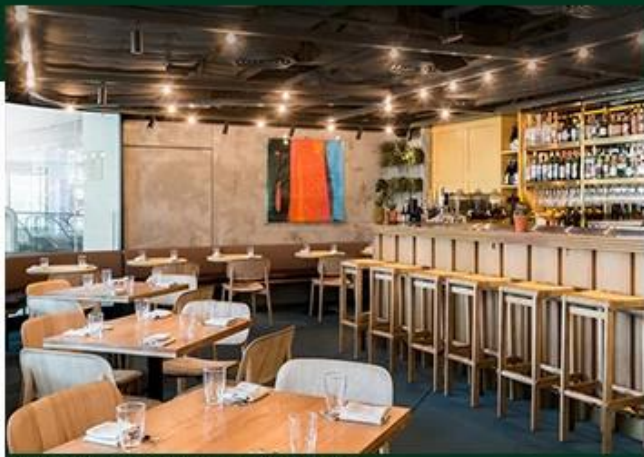
COMMISSARY RESTAURANT, HONG KONG