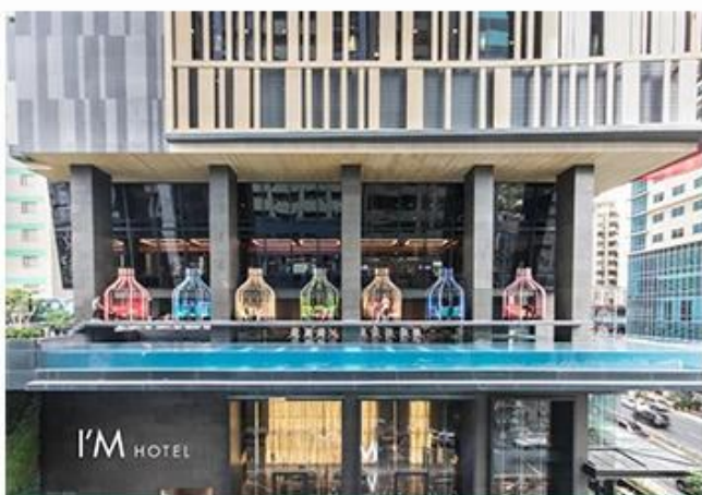
I'M HOTEL, MANILA RESTAURANT