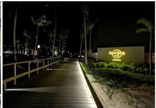
HARDROCK HOTEL RESTAURANT MALDIVES